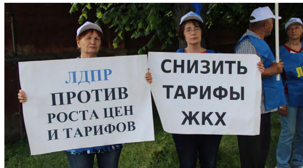
Жители России возмущены очередным ростом цен на ЖКХ. С 1 июля снова начнут расти тарифы

Сначала вырастут тарифы, а за ними подорожает всё остальное. Это точно случится. Потому что новые тарифы продавцы заложат в ценник, а оплатят покупатели — все мы. Поэтому жители России возмущены.