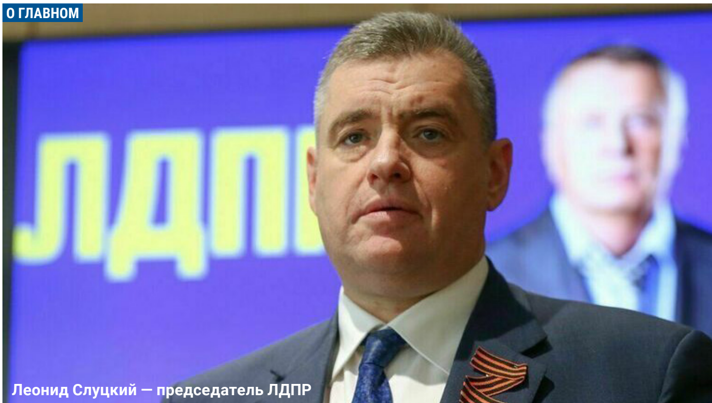
Леонид Слуцкий – председатель ЛДПР